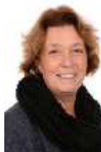
Intern begeleider en leerkracht groep 1-2 en 3-4